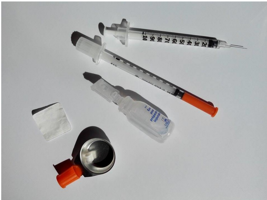
Seringues et matériel connexe

En tant que service d'échange de matériel d'injection et de matériel connexe, nous tenons à vous informer de la marche à suivre pour votre sécurité.